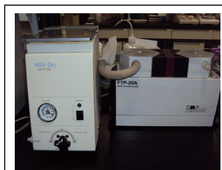
コンセントレーターとダイヤフ ラム型真空ポンプ