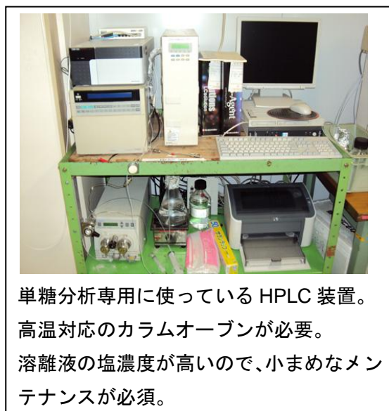
単糖分析専用に使っている HPLC 装置。 高温対応のカラムオーブンが必要。 溶離液の塩濃度が高いので、小まめなメン テナンスが必須。